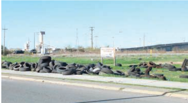
Las personas suelen dejar las llantas tiradas en cualquier lugar. | Feliciano Diéguez

"Desde este momento, los centros de acopio deben tener personal que atienda a las personas que acuden a dejar sus neumáticos, porque al menos en el sitio donde se depositan en esta colonia, no hay nadie, de esta forma las personas pueden