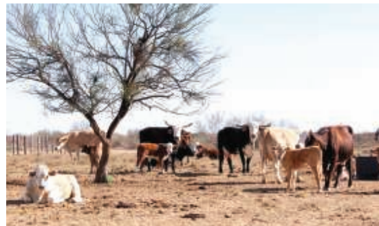
Los fríos recientes dañaron el poco pasto que dejaron las breves lluvias. | Alejandro Cabrera

El regidor declaró que el gobierno está en lo cierto en declarar ciertos lugares del estado de Tamaulipas como lugares de desastre, por lo tanto el gobernador como principal gobernante debe atender esa situación para que los campesinos, así como los comuneros, y asociaciones ganaderas reciban los apoyos que el gobierno les aporta cuando se presentan esas circunstancias y ocasiones como es la propia melaza, además del precio condonado a los alimentos o forrajes.